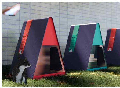
△ 포스코건설 길고양이 급식소