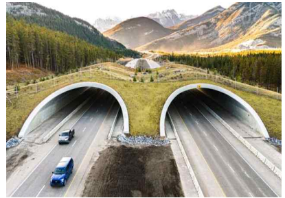
△ 캐나다 앨버타주 생태통로 디자인