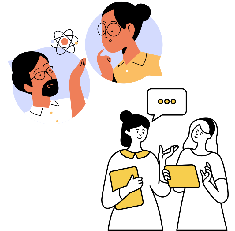
학생 & 담당교수

학생 : CHARM경험학점제 활동 〈 주차별 보고서 〉 〈 중간보고서 〉 〈 결과보고서 〉